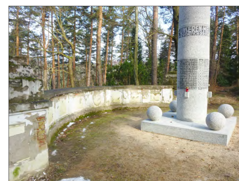
střední oblouková část