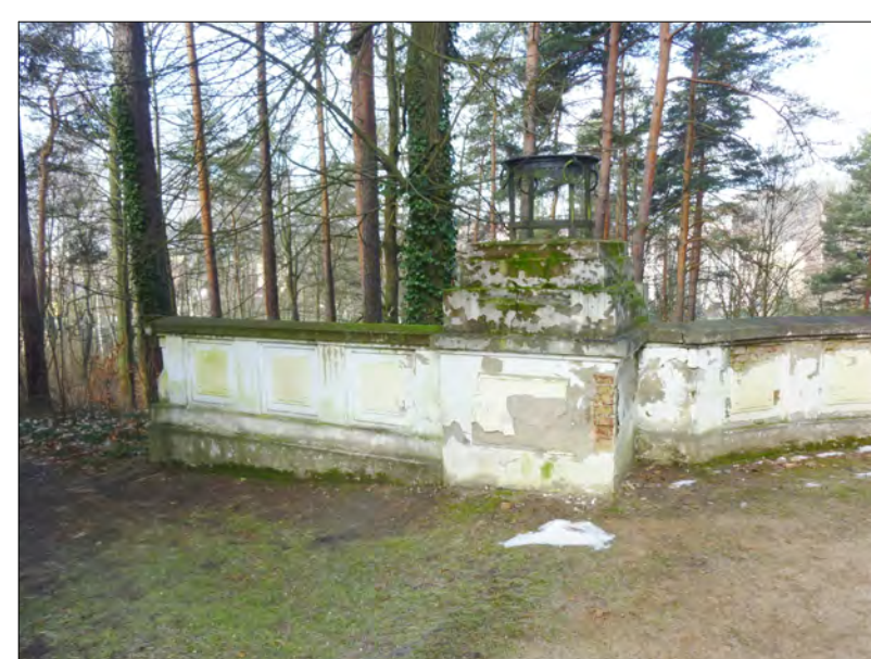
levé křídlo s levým pilířem